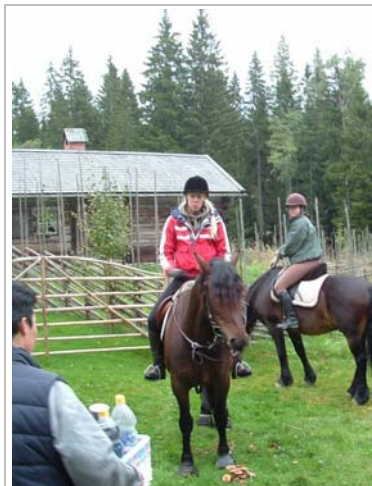
Lunch vid Knupbodarna